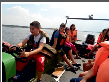
Motorcsónakkal a Tiszán

tábort ünnepélyes díjkiosztó gála zárta az utolsó estén. Nagyboldogasszony napján tartottunk hazafelé, ez alkalomból is betértünk a Tihanyi Apátságához.